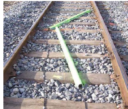
Cordes Optiques fixées sur les traverses de la voie